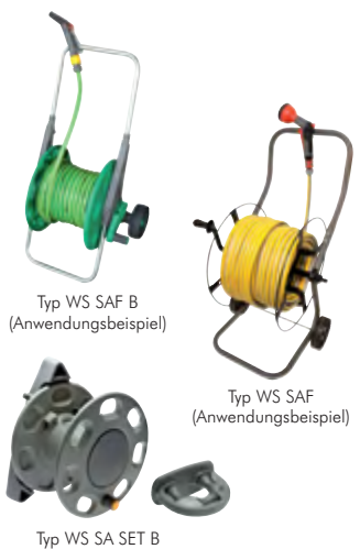
Typ WS SAF B (Anwendungsbeispiel)